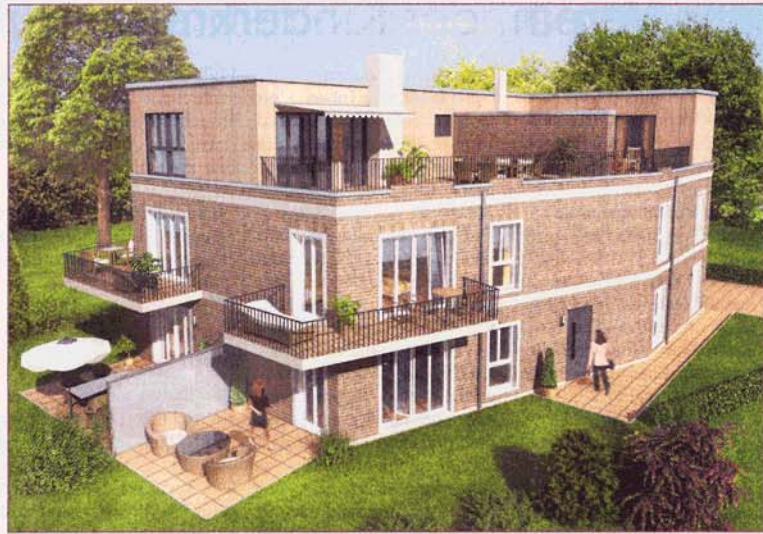
Am Volksdorfer Damm 31 werden fünf hochwertig ausgestattete Eigentumswohnungen in solider Bauweise mit ansprechender, markanter Optik errichtet

Die interessierten Anwohner und Bürger werden es schon bemerkt haben: am Volksdorfer Damm 31 wird seit mehreren Monaten gebaut. Hier erfahren Sie mehr über das individuelle Bauprojekt. Das neue und exklusive Wohnobjekt, welches durch die HWG Hamburg Wohnen GmbH gemeinsam mit TOM-Architekten aus Volksdorf geplant und realisiert wurde, wird durch das Immobilienunternehmen Grossmann & Berger präsentiert und vermittelt. Am Volksdorfer Damm, mit einer Bushaltestelle in unmittelbarer Nähe und nur wenige Minuten vom Zentrum Volksdorfs entfernt, verspricht das Ensemble eine hohe Lebensqualität mit